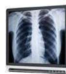
Matériel adapté à un environnement stérile