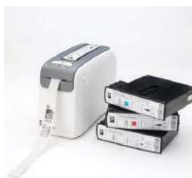
Bracelets d'identification patients