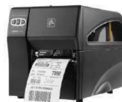
Imprimantes à étiquettes pour milieu médical—imprimante zebra